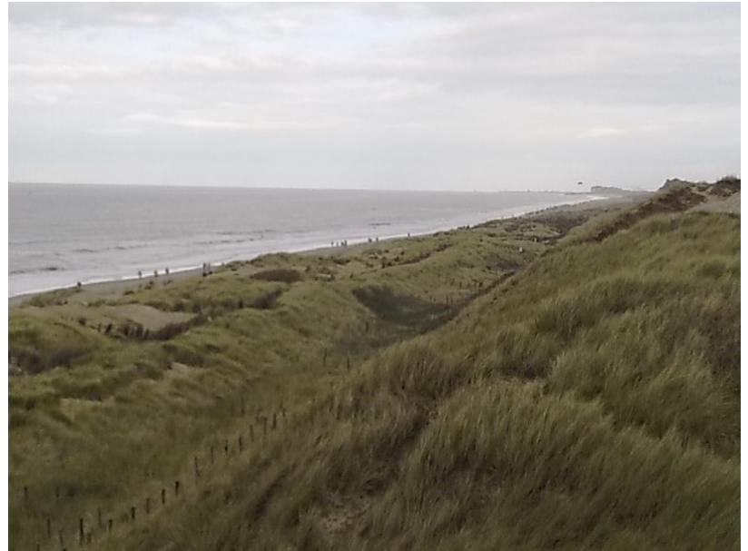
Unten: Einer der vielen Strandzugänge über den hohen Randdünen.