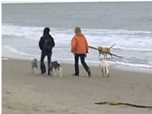
Hunde sind an vielen Teilen des kilometerlangen Strandes erlaubt. Unten: Ansicht von den Dünen bei Hochwasser