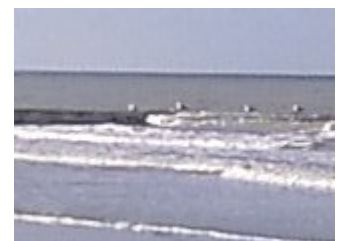
Rechts oben: die unendliche Weite des Meeres