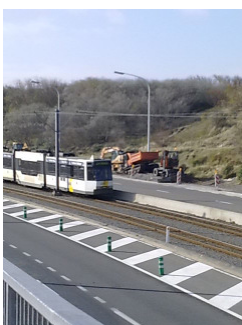
Die Küstentram verbindet alle Seebäder Belgiens .