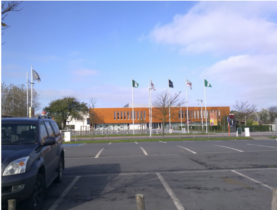
Das Gästehaus von Bredene-Duinen.

unten: Die endlosen Dünen laden zum Wandern ein.