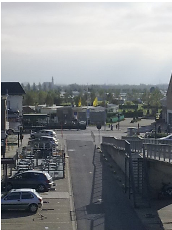
Links: ein Teil des Zentrums

Unten: Blick auf den Dahlienpark im Herzen von Bredene.